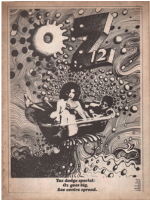
OZ, mai 68, cover Martin Sharp